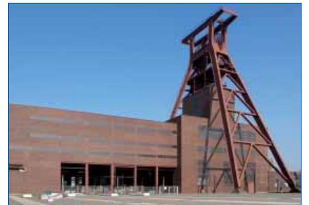
GEZE Reference objects